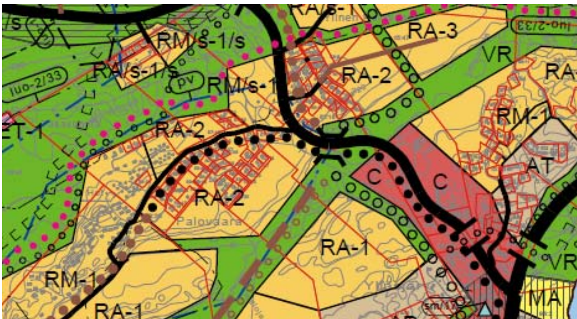
Kuva 1. Ote Ylläksen yleiskaavan muutoksesta.

YleiskaavaKolarin kunnanvaltuusto on hyväksynyt Ylläksen yleiskaavan muutoksen 27.2.2008. (kuva 1).