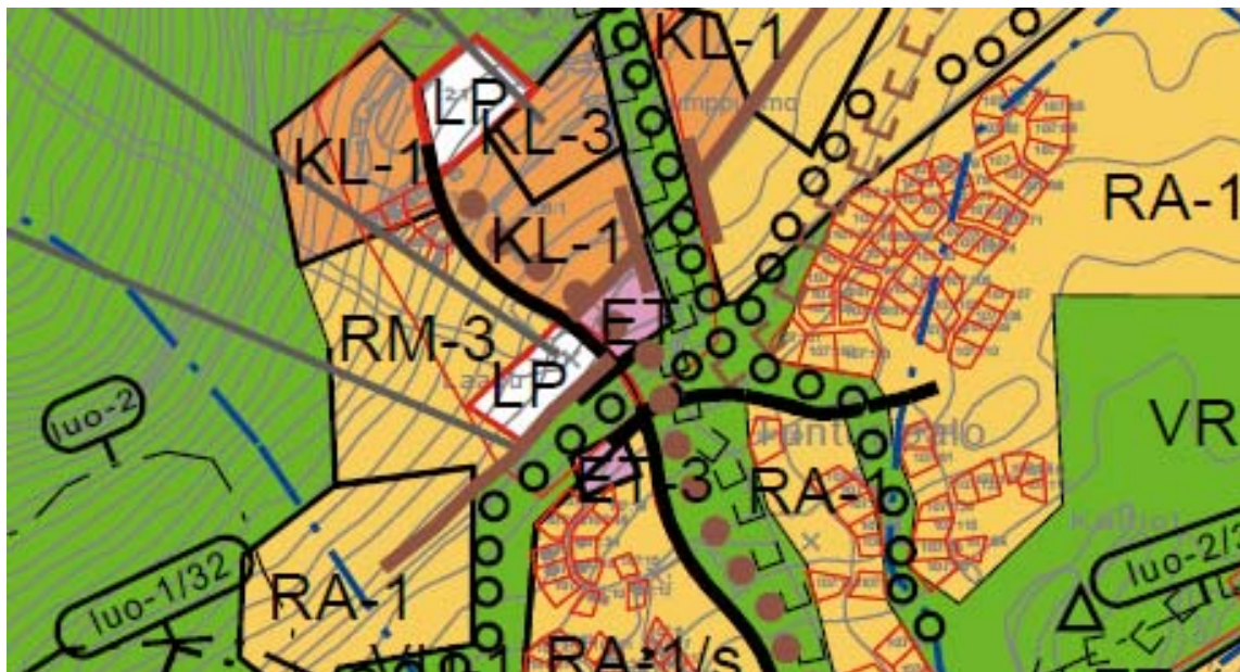
Kuva 1. Ote Ylläksen yleiskaavan muutoksesta.

Ylläksen yleiskaavassa korttelin 455 alue on osoitettu osittain KL-1 (Hotelli- ja liikerakennusten alue) alueeksi ja RM-3 (Hotelli ja matkailupalvelujen alue) alueeksi (kuva 1).