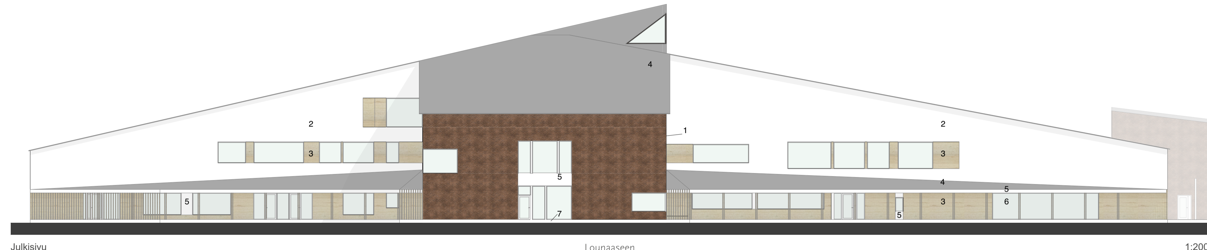
Julkisivu Lounaaseen 1:200